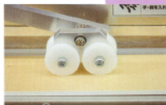
溝切り刃カバーがローラーになり 薄いノベ板への溝切り時に スムーズに押さえつけられます

他にも 出っ張りを減らして 素々細部 への込みスジで 溝切り深さを調整 標準用治具を大型化 のこ刃、溝切り刃を 六角ネジ化で素々交換 などなど より安全で 便利になりました