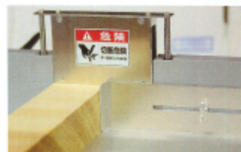
追加シャッターで 厚いノベ板を 切断する時も のこ刃が出ません